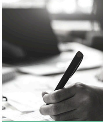
habilitats de síntesi

Per tal de desenvolupar la capacitat de descompondre els problemes en els seus components essencials i identificar patrons i causes subjacents