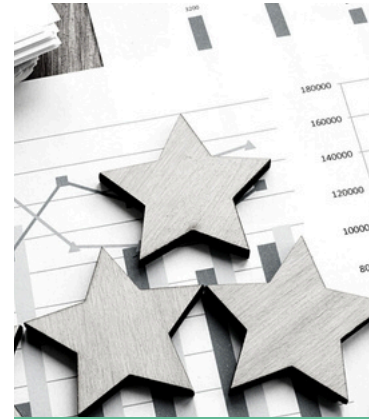
compétences en évaluation

Il s'agit de rassembler toutes les informations et tous les points de vue provenant de diverses sources afin de créer des solutions complètes et innovantes.